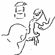
Donner l'eau à celui qui a soif