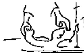
Onction des malades

Il y a une chose que l'on retrouve dans chacun des 7 sacrements . Observe les dessins et tu vas la trouver. Écris cela dans l'encadré.