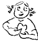
Donner son amitié