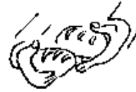
Le pain qui nourrit